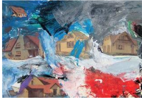
Référence culturelle incontournable : William Turner : Tempêtes