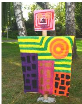
Inspiration Friedensreich Hundertwasser

La réalisation d'épouvantails est assez simple. Il suffit d'avoir une structure en croix puis de l'habiller.