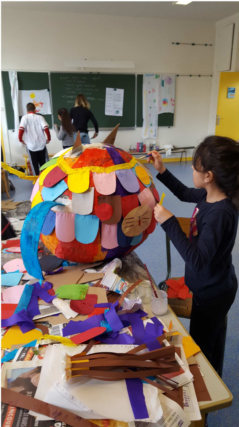
Mascotte presque terminée