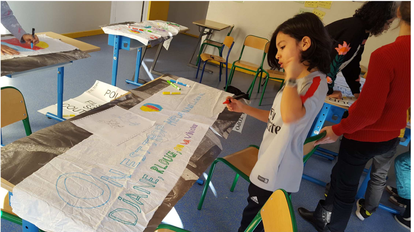
Création des banderoles