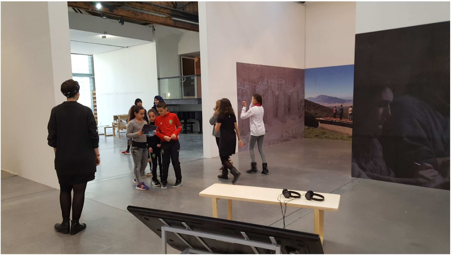
Visite au CRAC