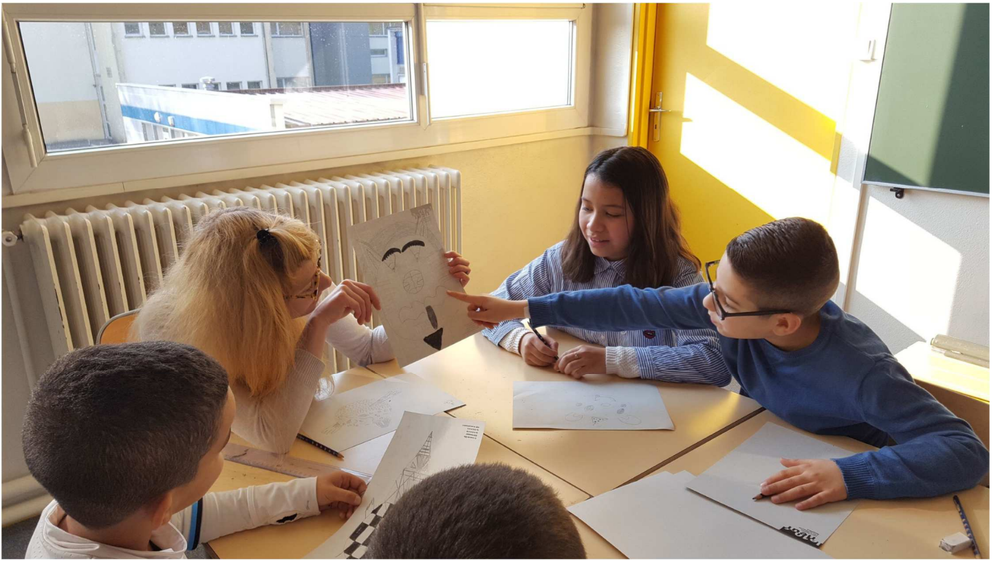
Recherche de la mascotte