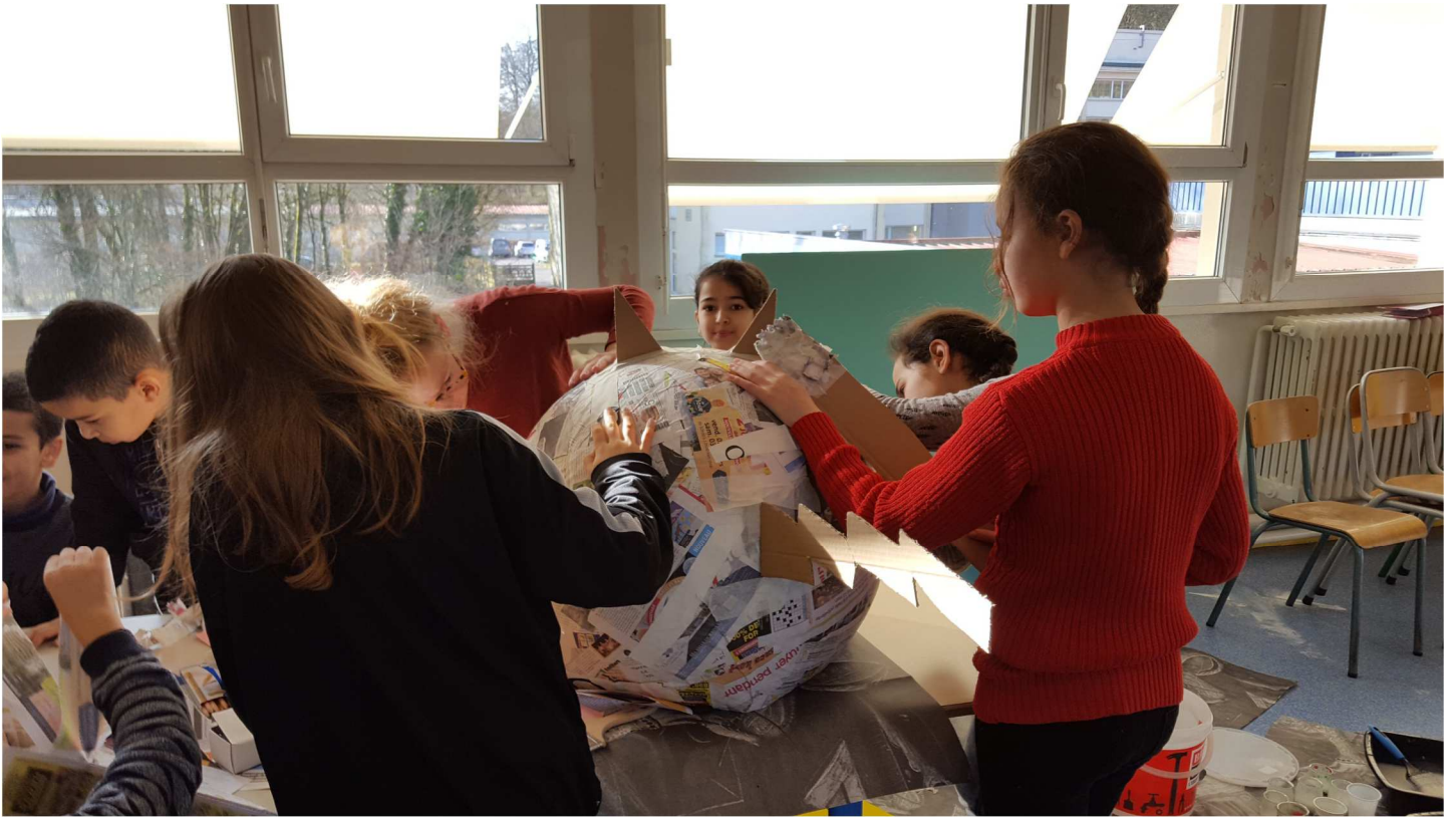
Création de la mascotte