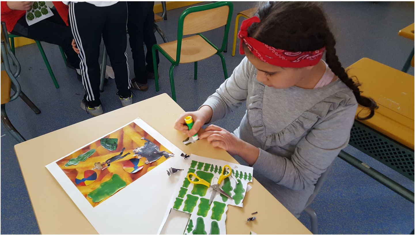
Élaboration des affiches