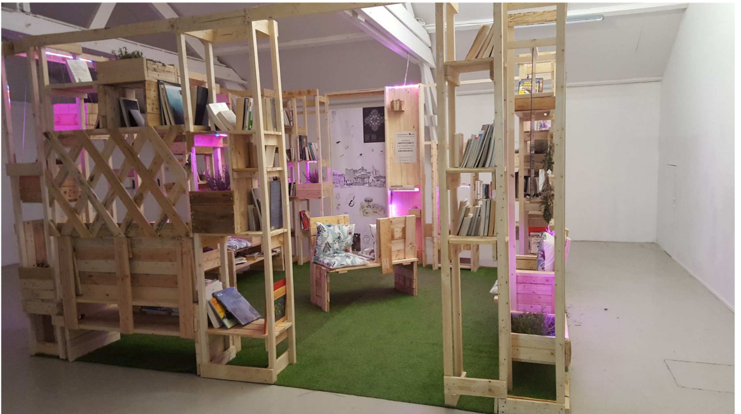
Visite au CRAC (suite)