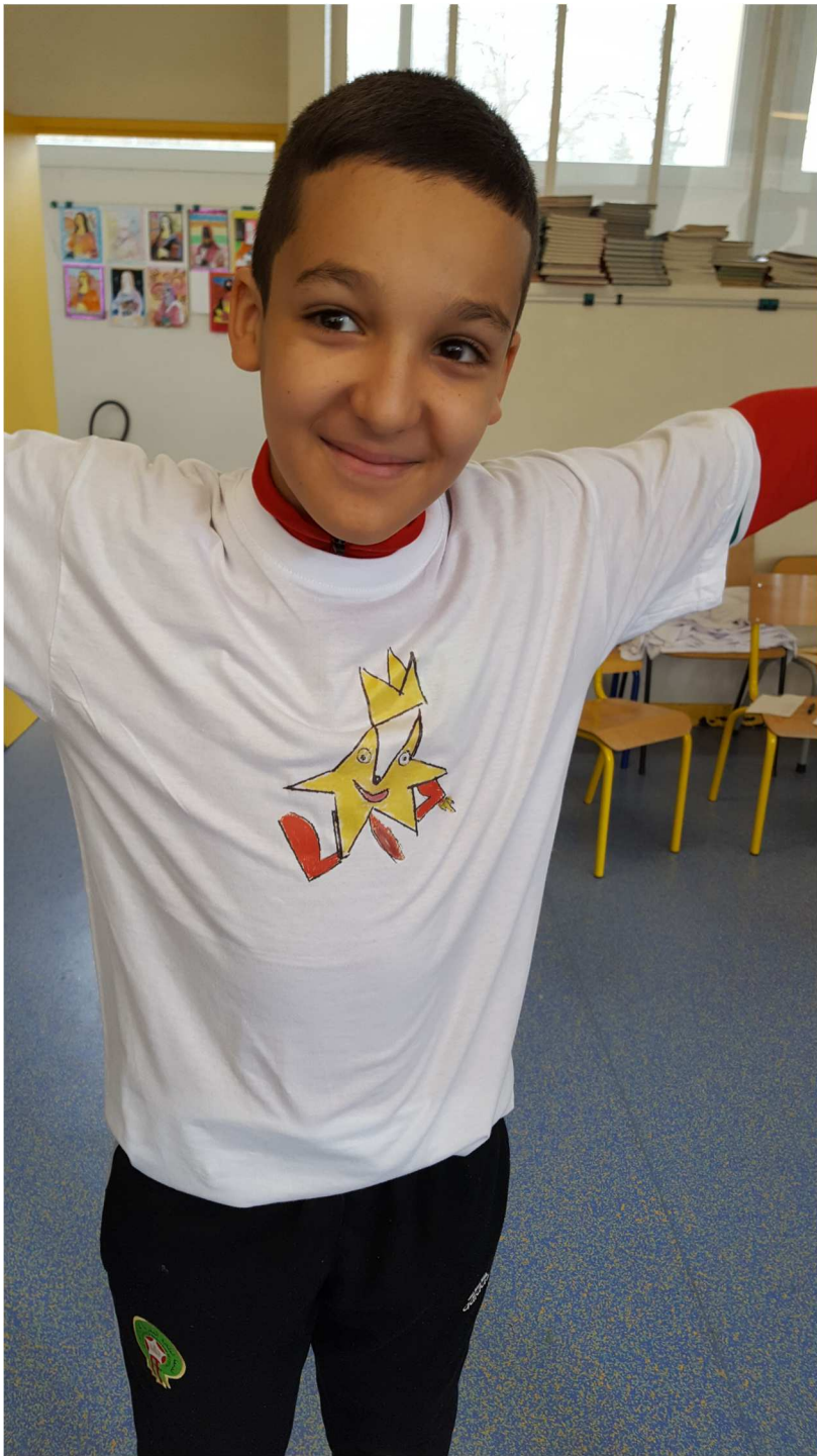
T-shirt avec logo final