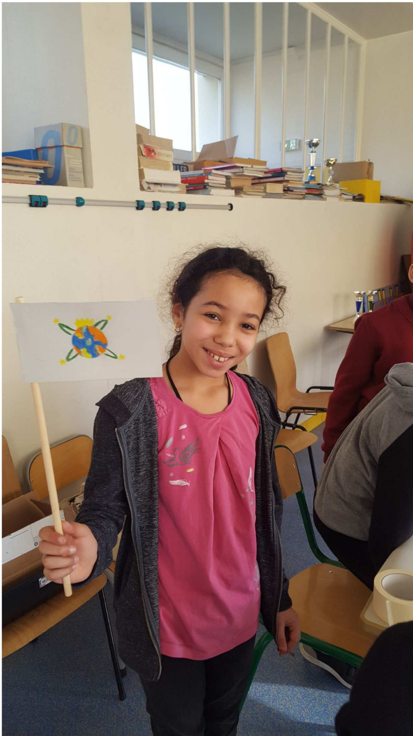
Recherche du logo