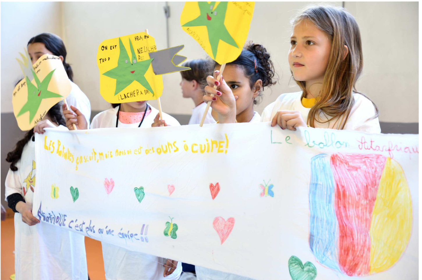
Les supporters le jour du match