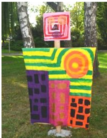
Inspiration Friedensreich Hundertwasser

La réalisation d'épouvantails est assez simple. Il suffit d'avoir une structure en croix puis de l'habiller.